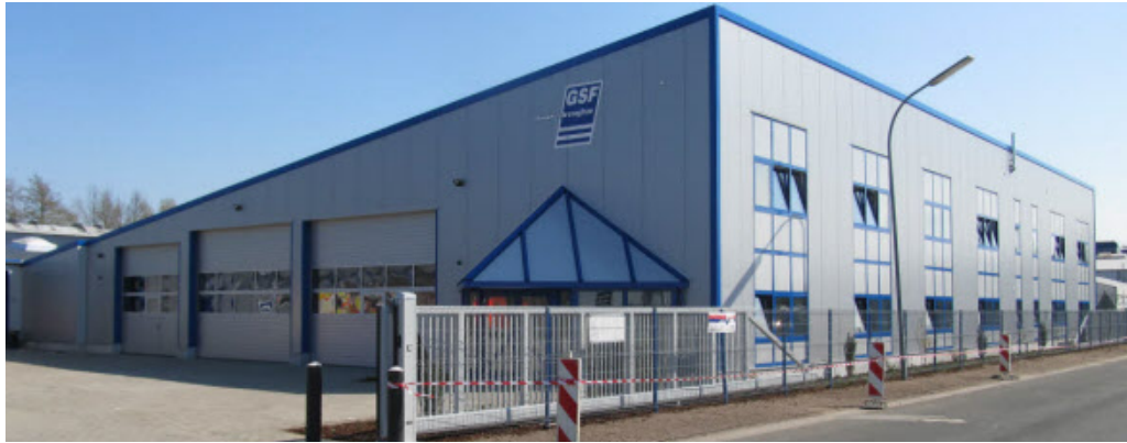
In Twist wurde die neue Halle errichtet.